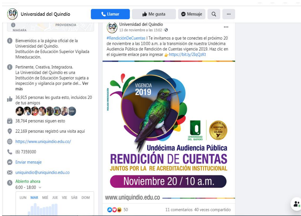
Foto 3. Divulgación a través de Facebook de la rendición Pública de cuentas – Vigencia 2019

En la rendición pública de cuentas el Rector de la institución presentó los indicadores que dan cuenta de los avances en el Plan de Desarrollo Institucional durante la vigencia 2019 y resaltó proyectos importantes de inversión para la Universidad que se llevarán a cabo en las próximas vigencias.