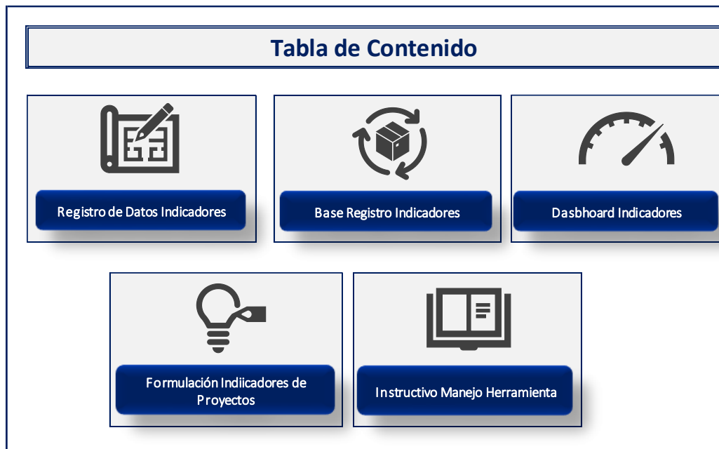
Ilustración 2: hoja 1. Tabla de Contenido

Contenido: Esta hoja permite navegar por el archivo de excel y presenta el contenido general de la matriz.