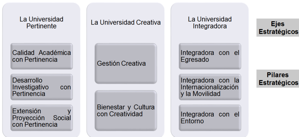
Ilustración 3. Ejes y Pilares para el PDI 2016-2015 - Fuente: Plan de Gestión Rector

Dentro de esta estructura se identifican 3 ejes estratégicos sobre los cuales se soporta el PDI y 8 pilares estratégicos que sirven de soporte de las metas propuestas. Es necesario destacar que la interacción de los pilares, los ejes y la transversalidad de estos, genera un dinamismo al momento de la ejecución de cada una de las metas a alcanzar por parte de la Universidad.