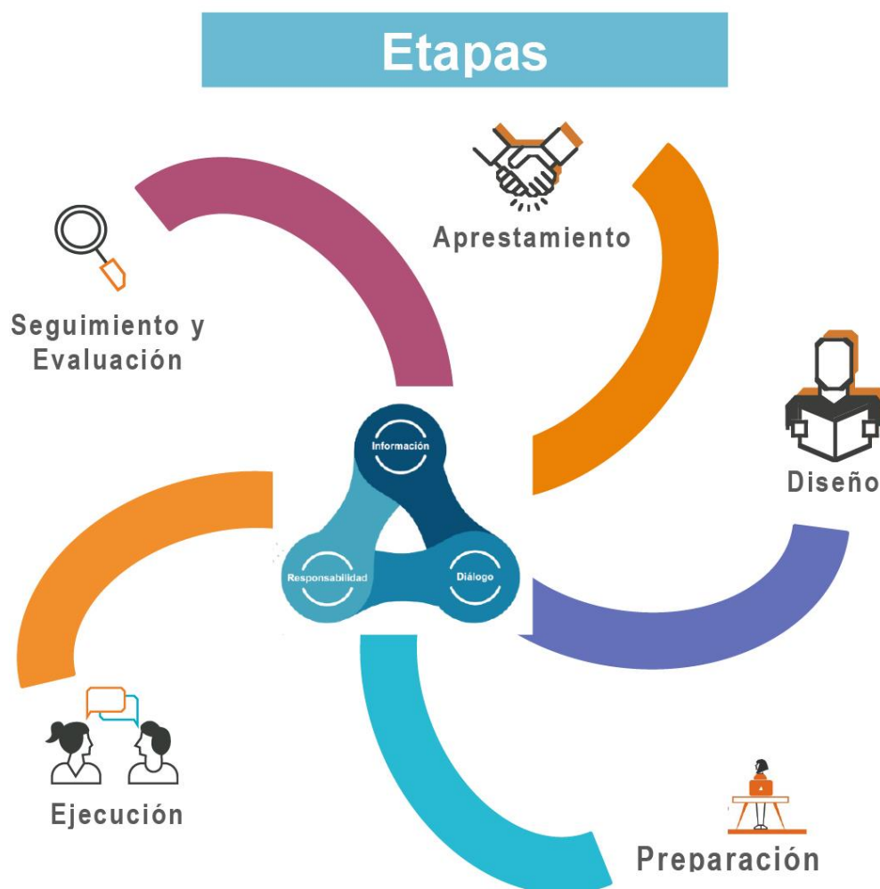
Figura #1