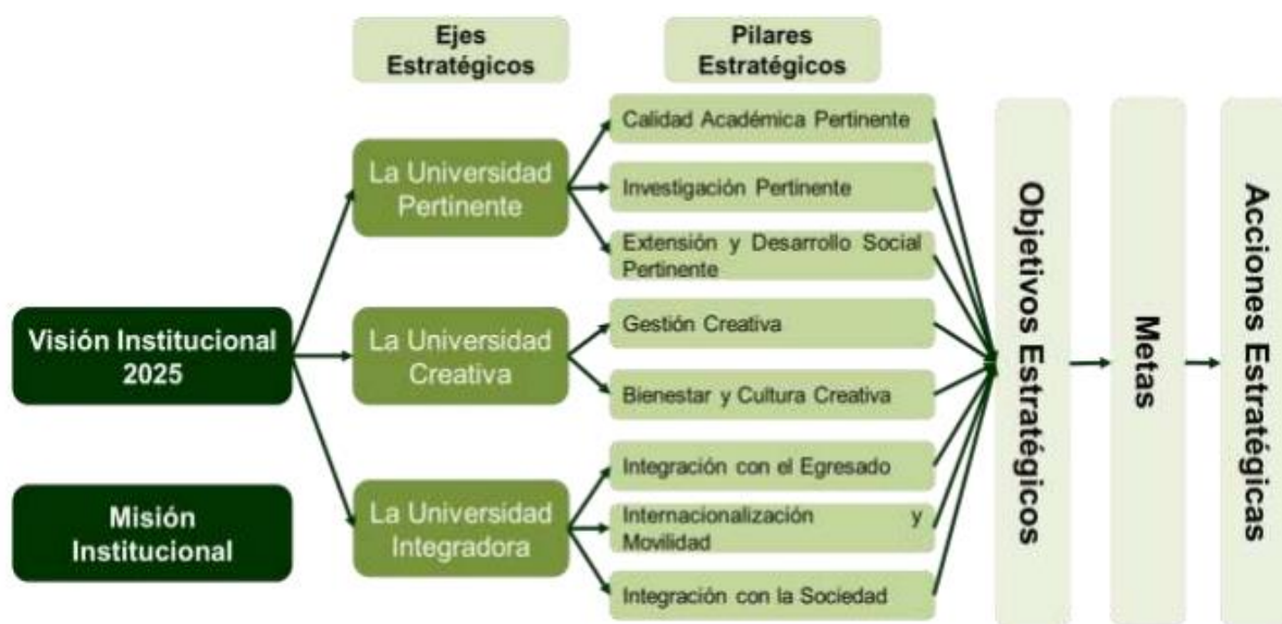
Figura 2. Estructura PDI 2016-2025

Ilustración –Estructura del PDI 2016-2025 desde lo misional-Dirección de Planeación Institucional