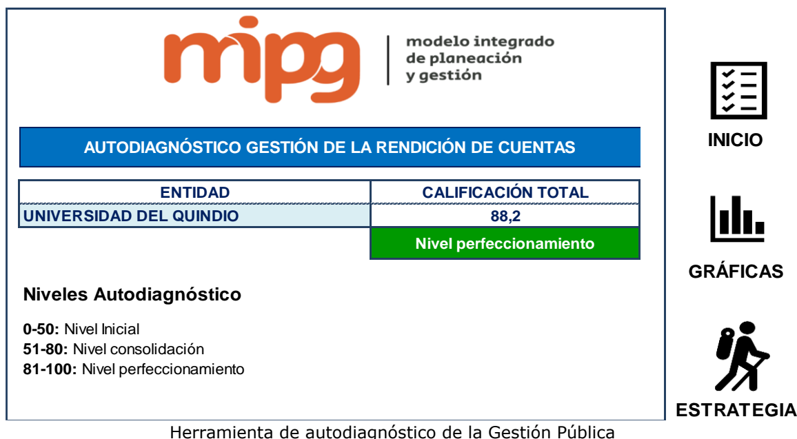
Gráfica 1. Calificación total